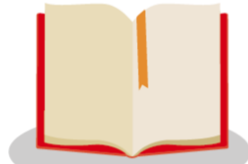
"OBLIGACIONES DE TRANSPARENCIA COMUNES" ARTÍCULO 121