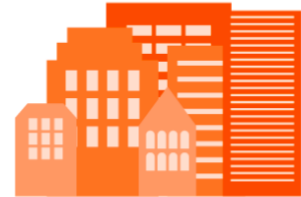
"EJECUCIÓN DE OBRA PÚBLICA POR INVITACIÓN RESTRINGIDA" ARTÍCULO 143