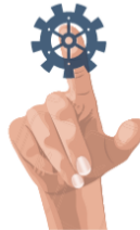
"OBLIGACIONES PARA PARTIDOS POLÍTICOS" ARTÍCULO 129